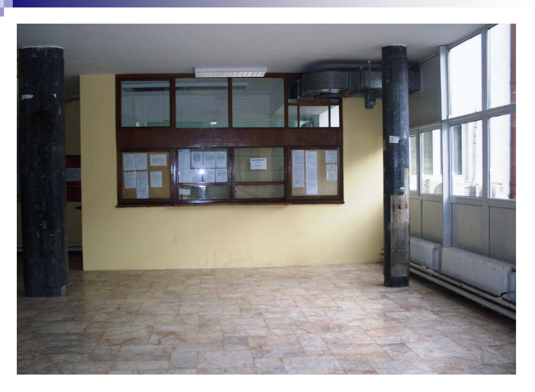
High railway School of Professional Studies