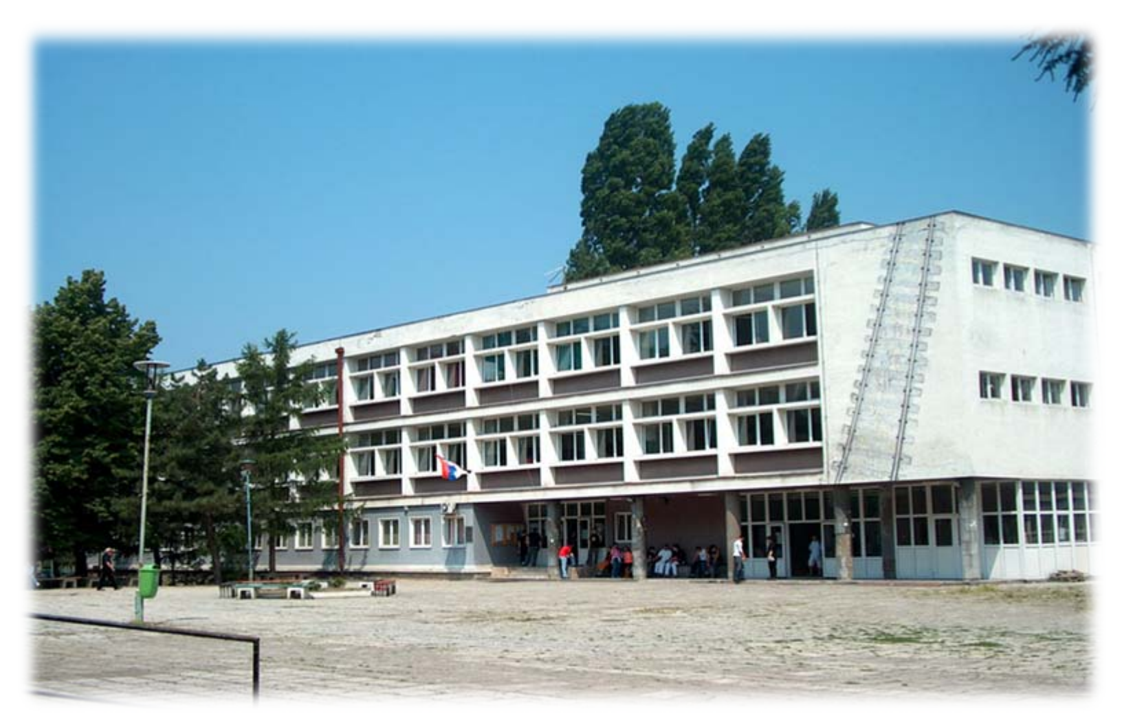
High railway School of Professional Studies