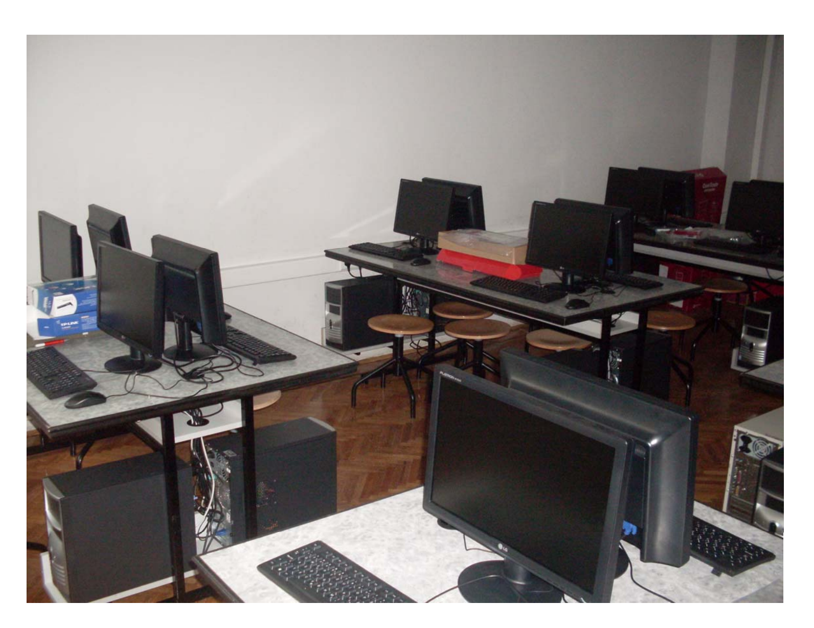
High railway School of Professional Studies